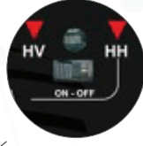
On / Off Anahtar